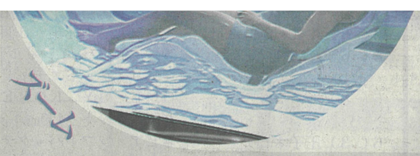
サイエンスが25年の大阪・関西万博で展示を予定する「人間洗濯機」(イメージ)

「親にせがんで万博には20回くらい行きました。ですから、万博が本社のある大阪の地でも一度あると決まった時に、スポンサーになるために死に物狂いに頑張って売り上げを足し算でなくかけ算で増やしていこうとしました。スポンサーになったのは第1段階の夢の実現です。前回の万博から(25年時点)55年たつて人間洗濯機がこれだけ進化したというのを見ていただければ。そして小学生だった僕みたいな子供たちに夢を感じてもらいたいです」